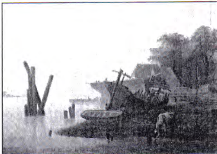
Dieses Gemälde von Christian Grabau zeigt die Werft von Hinrich Raschen in St. Magnus im Jahr 1840, zwei Jahre vor dem Konkurs. Auch dieser Schiffbauplatz wird in Dr. Pawliks Buch erwähnt.